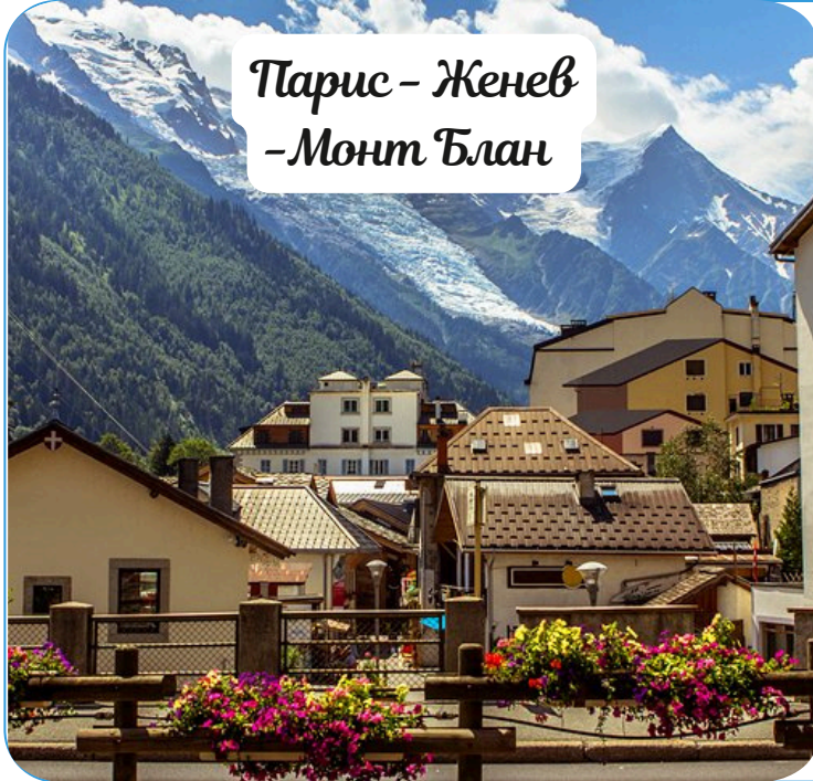
Парис – Женев –Монт Блан